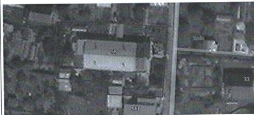
Ситуационная схема масштаб 1:1000

или подписавших соглашение о перераспределении земельных участков)