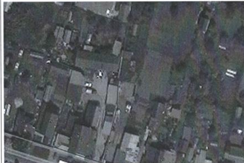
Ситуационная схема масштаб 1:1000

или подписавших соглашение о перераспределении земельных участков)