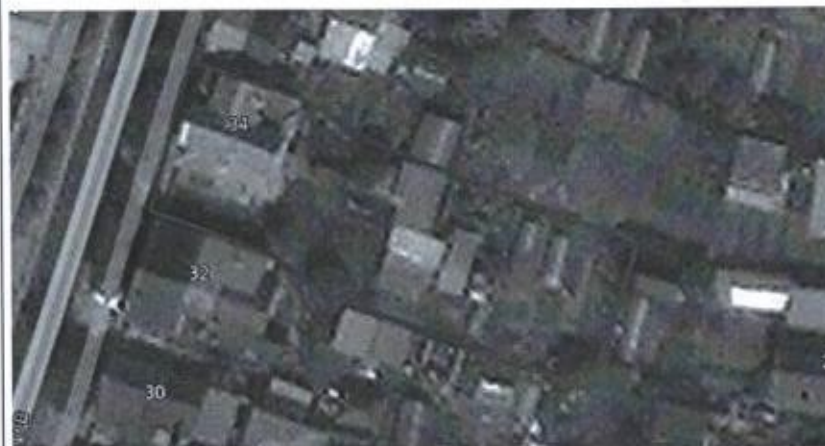
Ситуационная схема масштаб 1:1000