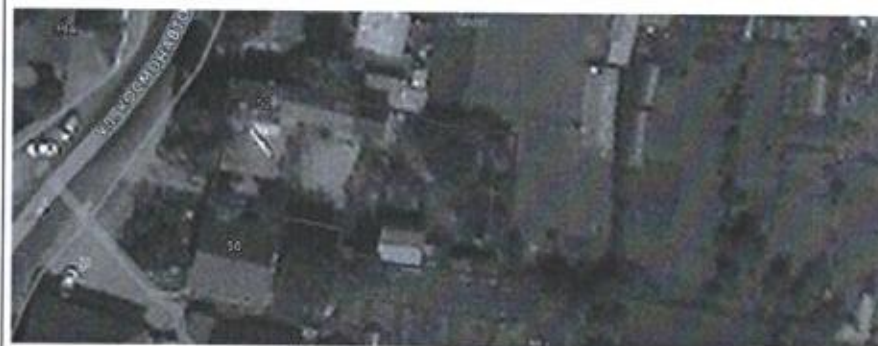
Ситуационная схема масштаб 1:1000

или подписавших соглашение о перераспределении земельных участков)