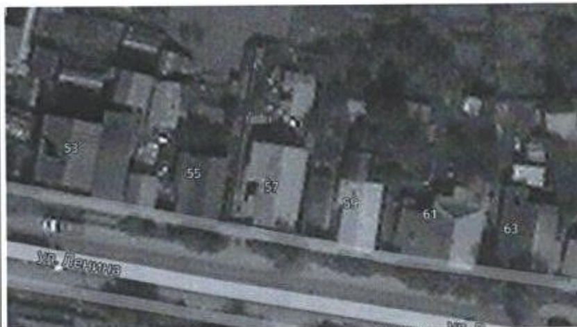
Ситуационная схема масштаб 1:1000