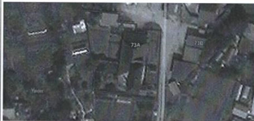
Ситуационная схема масштаб 1:1000

или подписавших соглашение о перераспределении земельных участков)