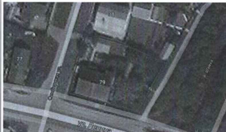
Ситуационная схема масштаб 1:1000

(наименование документа об утверждении, включая органы государственной власти или органов местного самоуправления, принявших решение об утверждении схемы или подписавших соглашение о перераспределении земельных участков)