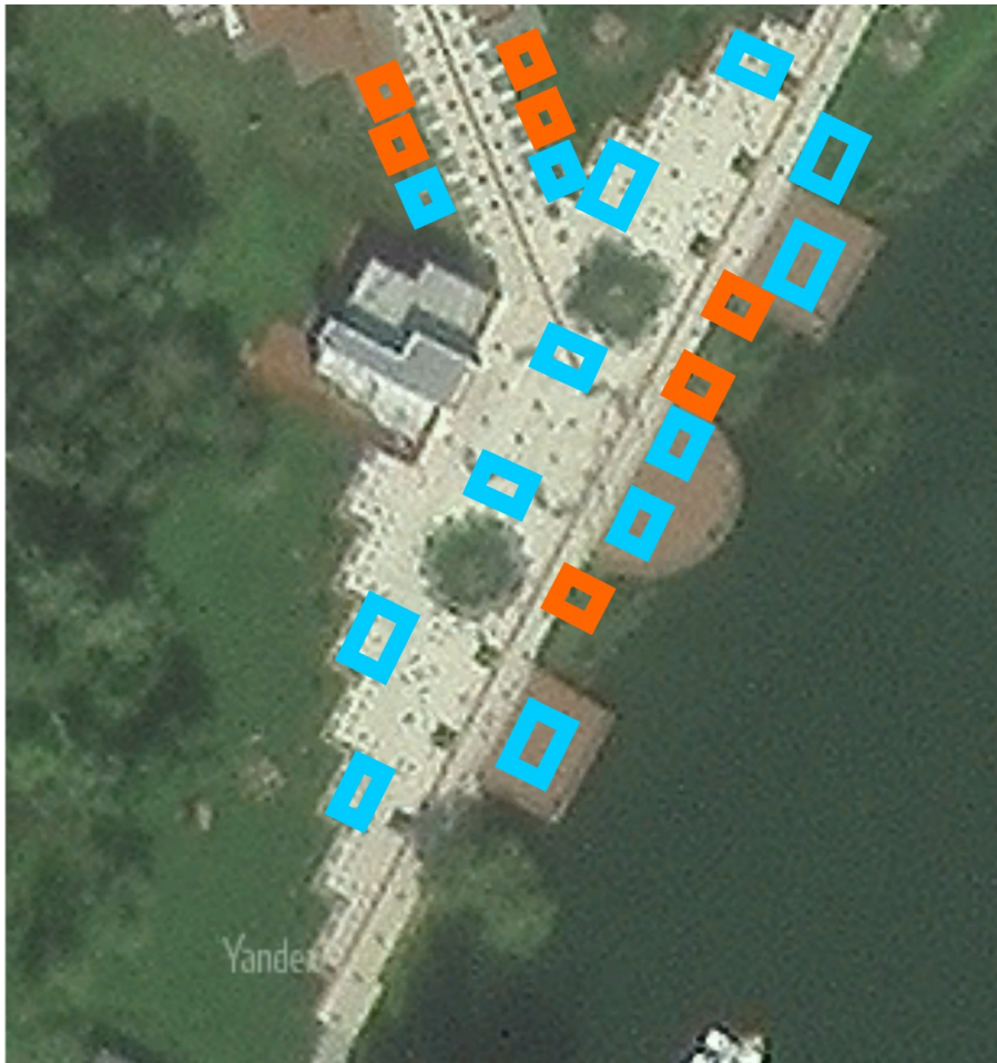
Схема размещения торговых мест по продаже товаров (выполнения работ, оказания услуг) на ярмарке 18 мая 2024 г., по адресу: Нижегородская область, городской округ город Арзамас, город Арзамас, проспект Ленина, Парк культуры и отдыха им. А.П. Гайдара территория прилегающая к комьюнити центру