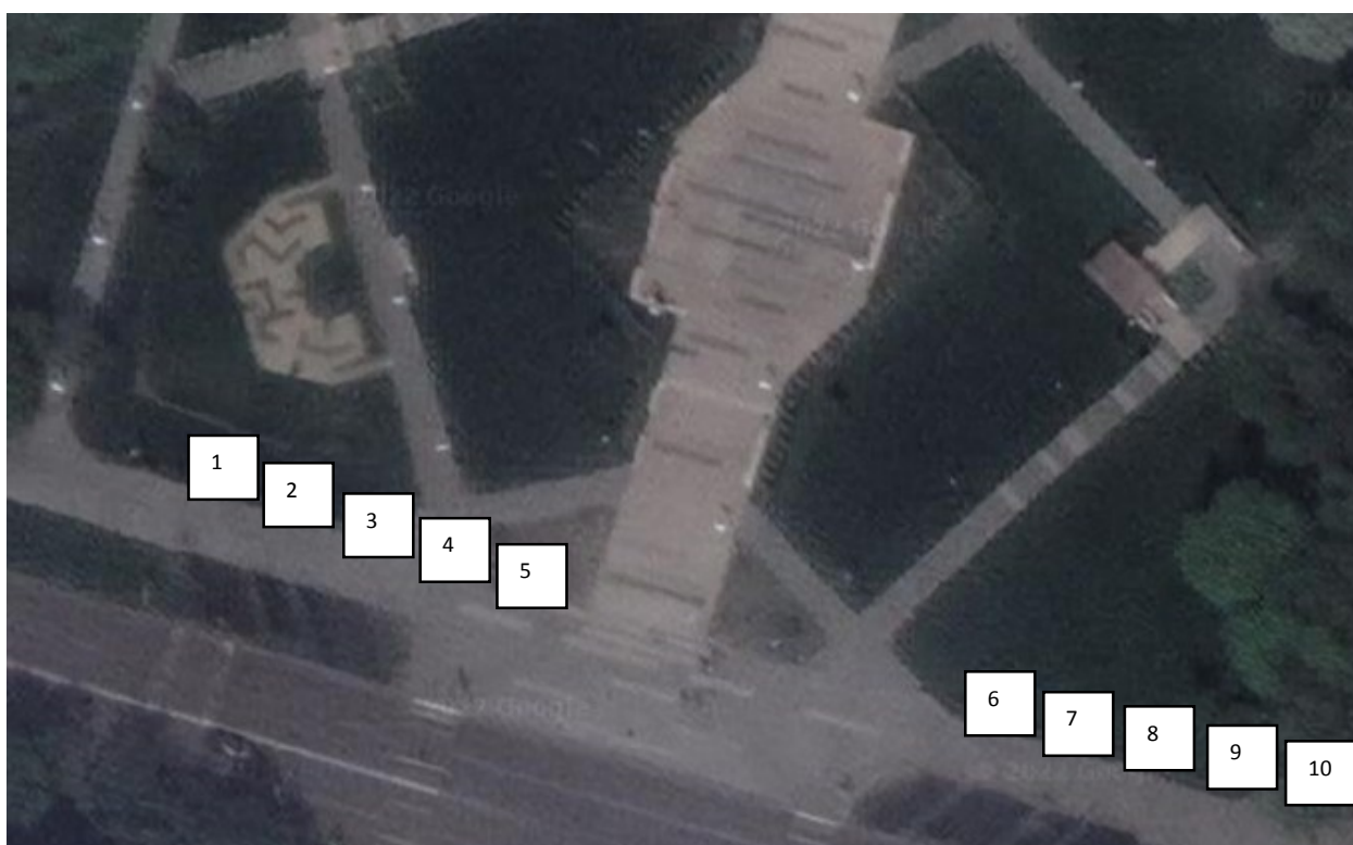
Схема размещения мест по продаже товаров (выполнения работ, оказания услуг) на праздничной ярмарке 03 сентября 2022 г, по адресу г. Арзамас, площадь 1 Мая

Места № 1, № 5, № 6 – реализация продукции общественного питания; Места с № 2 , № 3, № 4, с № 6 - № 9 – реализация непродовольственных товаров;