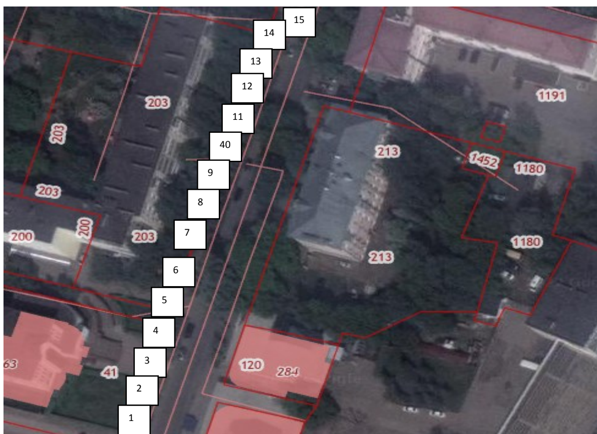
Схема размещения мест по продаже товаров (выполнения работ, оказания услуг) на праздничной ярмарке 03 сентября 2022 г, по адресу г. Арзамас, ул. Кирова, территория между домами № 47 А - № 49

Места с № 1 – № 15 – реализация непродовольственных товаров.